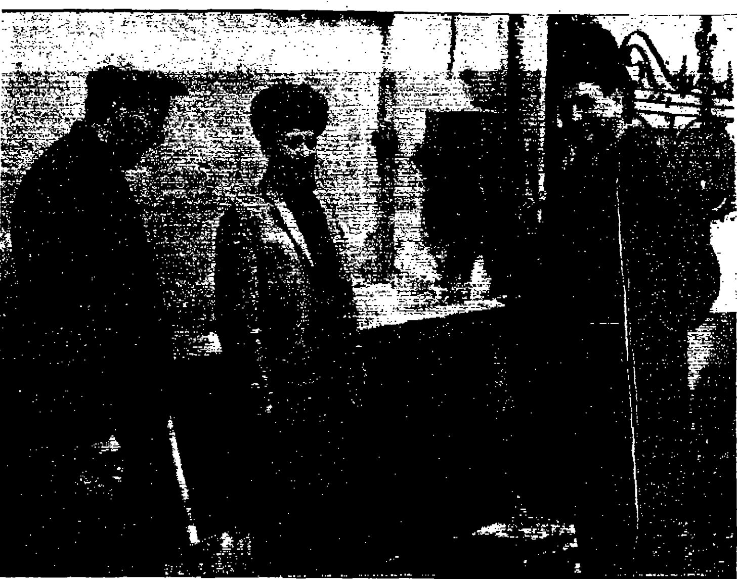
المكثور غونار يارنغ يتحدث السرمع المسمخمين الروس في السفارة السويديّة لدى وصوله الى موسكو قضاء عطلة عيد الميلاد «مسورة لكونينديرس»

الجم المتحدة - رويتر - اعلان ان الشيخ صباح السلام الصباح امير الكويت الذي يقوم حاليا بزيارة الكويت المتحدة ستبذل مع يوقات السكرتير المعلم لاكم الامة هنا يوم الاثنين الماضي وسيحضر امير الكويت الذي يرافقه الشيخ صباح احمد الصباح وزير خارجية الكويت خلاه استقبال تكريما له في مقر الامة المتحدة